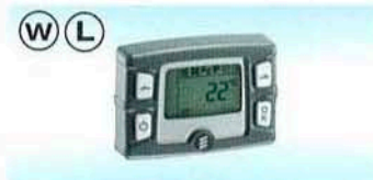
Tidsur EasyStart T