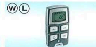
Fjernkontroll EasyStart R+