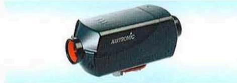
AIRTRONIC B4 AIRTRONIC D4