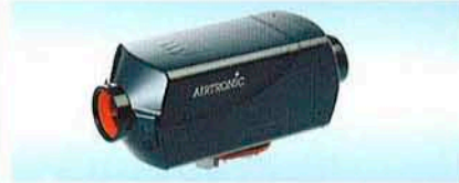
AIRTRONIC B1L C compact AIRTRONIC D2