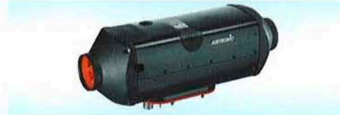
AIRTRONIC B5L C AIRTRONIC D5