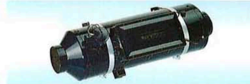
- DBL C