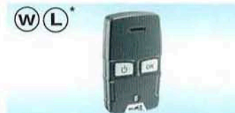
Fjernkontroll EasyStart R